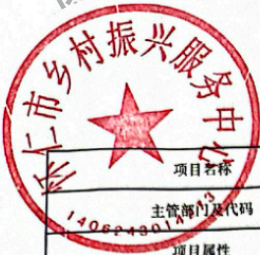
怀仁市县(区)级预算部门(单位)项目支出绩效目标表 (2025年度)