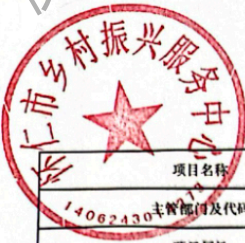
怀仁市县(区)级预算部门(单位)项目支出绩效目标表 (2025年度)