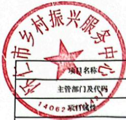
怀仁市县(区)级预算部门(单位)项目支出绩效目标表 (2025年度)