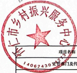
怀仁市县(区)级预算部门(单位)项目支出绩效目标表 (2025年度)