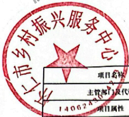
怀仁市县(区)级预算部门(单位)项目支出绩效目标表 (2025年度)