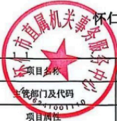
怀仁市县(区)级预算部门(单位)项目支出绩效目标表