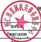
怀仁市县(区)级预算部门(单位)项目支出绩效目标表